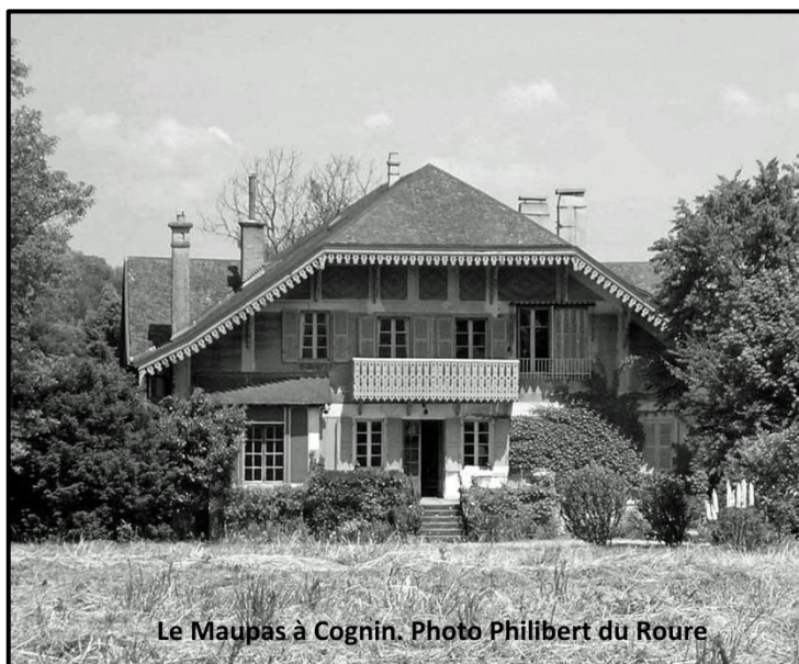
Le Maupas à Cognin.

La période de la seconde guerre mondiale le confine au Maupas qu'il quitte peu. Le temps disponible lui permet une importante création littéraire : La cendre chaude , La Sonate au clair de lune , L'ombre sur la maison , La Savoie , Les Yeux voilés , Notre-Dame-de-la-vie qui s'inspire du destin tragique d'une jeune fille de La Motte-Servolex, Le Remorqueur , Un crime sous le directoire .