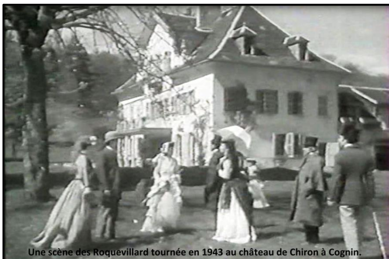
Une scène des Roquevillard tournée en 1943 au château de Chiron à Cognin.